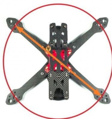
Рисунок 1 – Определяемые размеры дронов

Схема определения размеров дрона представлена на рисунке 1.